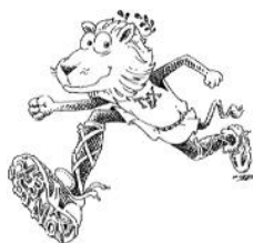
شکل ۲-۱- در تصویر بالا یک شیر علاقه مند به لاتک را در حال دویدن می بینید

به روش ساده زیر، یک تصویر را می توان در نوشته ی خود آورد: