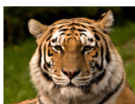
(ب) یک ببر