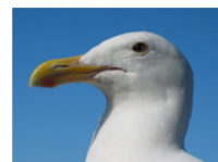
(آ) یک غو